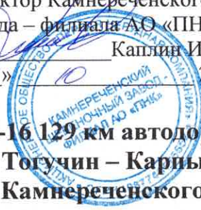
Схема охранного поста при перекрытии К-16 129 км автодороги «Р-255» - Тогучин- Карпысак (от 107 км до 110 км - Тогучин – Карпысак) на время производства массового взрыва в карьере Камнереченского щебеночного завода.